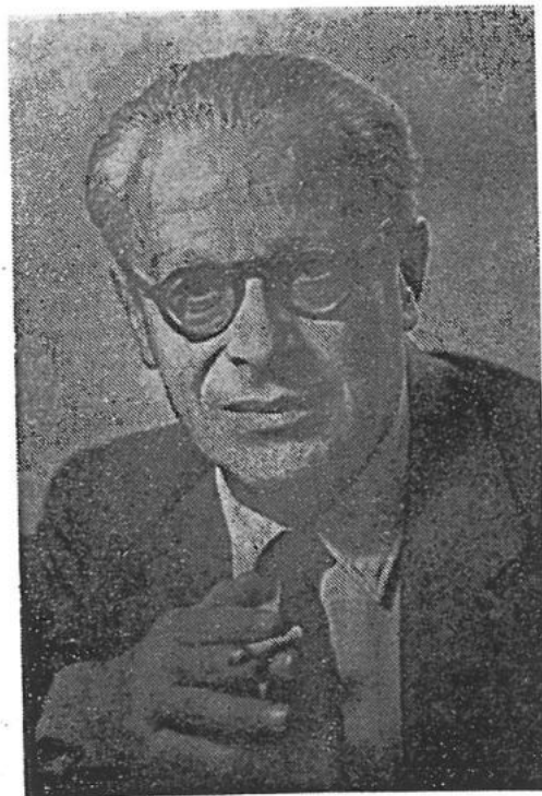
Tristan Tzara (Fotografie comunicată de Irina G. Atanasiu).

L'auteur du Faux traité d'esthétique ne pouvait plus le suivre, ce qui ne les empêchait pas de se faire des signes, de temps, en temps, des deux côtés du ravin qu'ils longeaient: